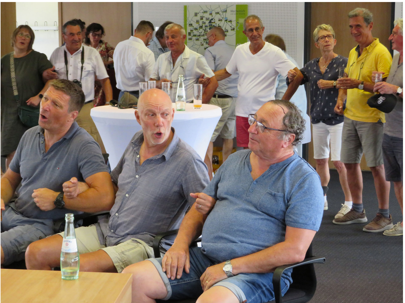
Zu kölschen Tön von der Band „UseM Lamäng“ wurde beim Empfang im Rathaus geschunkelt und gesungen.