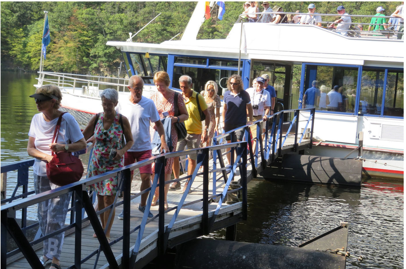
Zum Rahmenprogramm gehörte auch eine Schifffahrt auf dem Rursee.