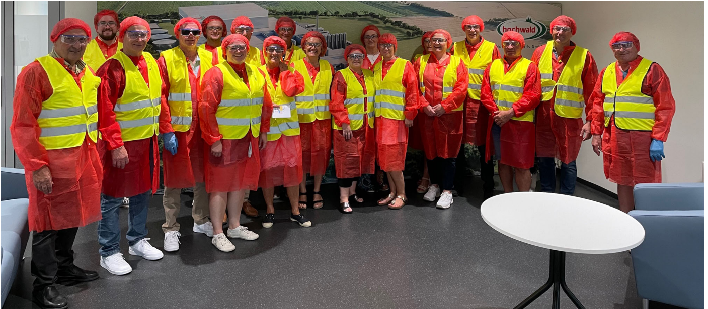
Rote Montur, gelbe Warnwesten: Derart ausgestattet begaben sich Gäste und Gastgeber auf eine Führung durch die Hochwald-Molkerei in Obergartzem.